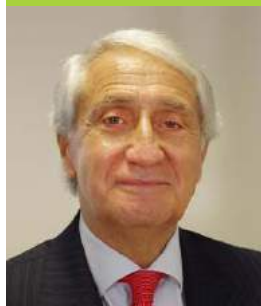
Carlos Mourato Nunes, Tenente-General Presidente da Autoridade Nacional de Proteção Civil

As coletividades de Cultura, Recreio e Desporto desempenham uma função de grande relevância na nossa sociedade.